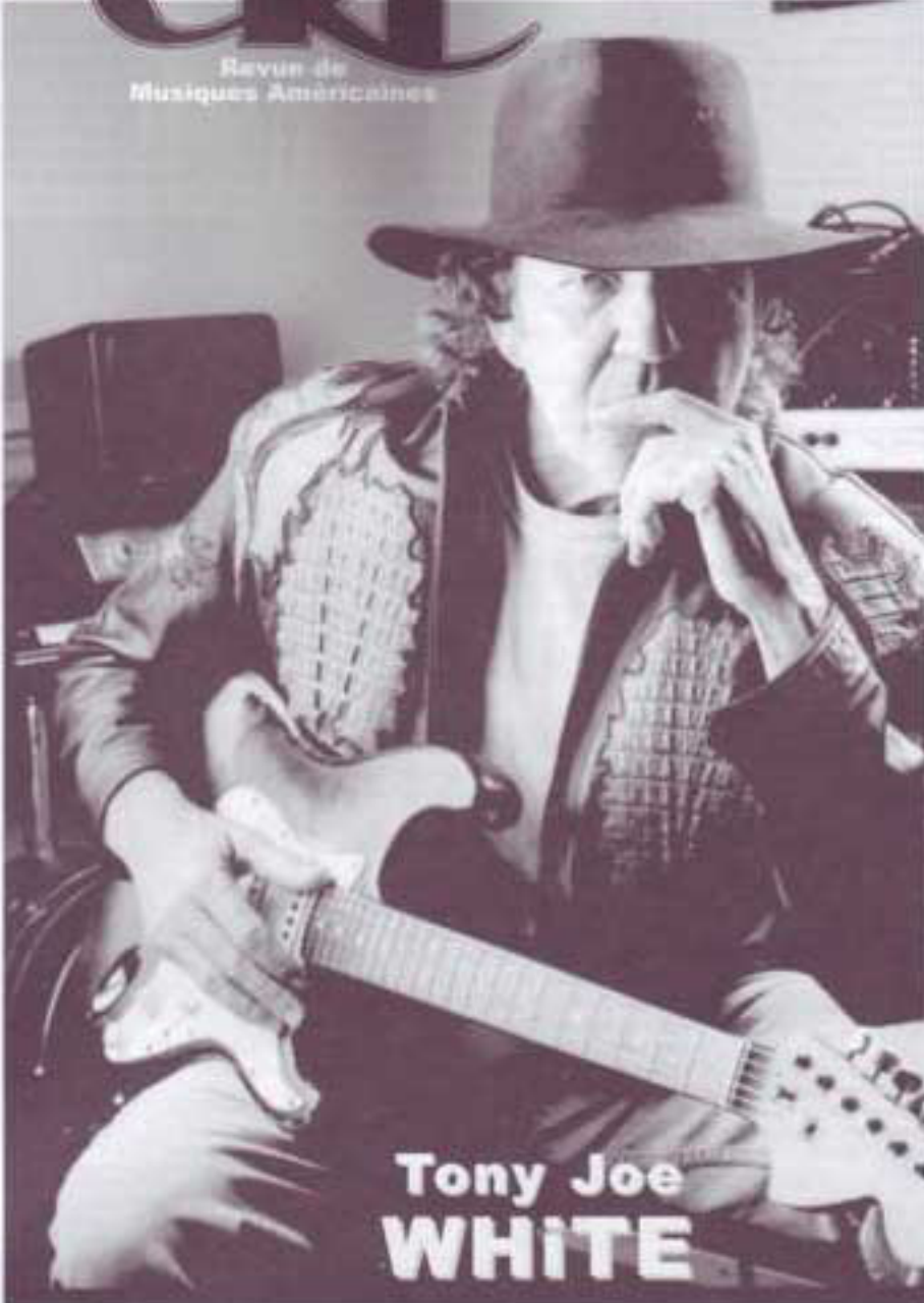
Tony Joe WHITE