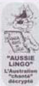
"AUSSIE LINGO" L'Australien "chante" décrypté

Country - Bluegrass & C* - Lone Riders - Cajun Kanga Routes - Nuit de la Glisse - Crock 'n' Roll